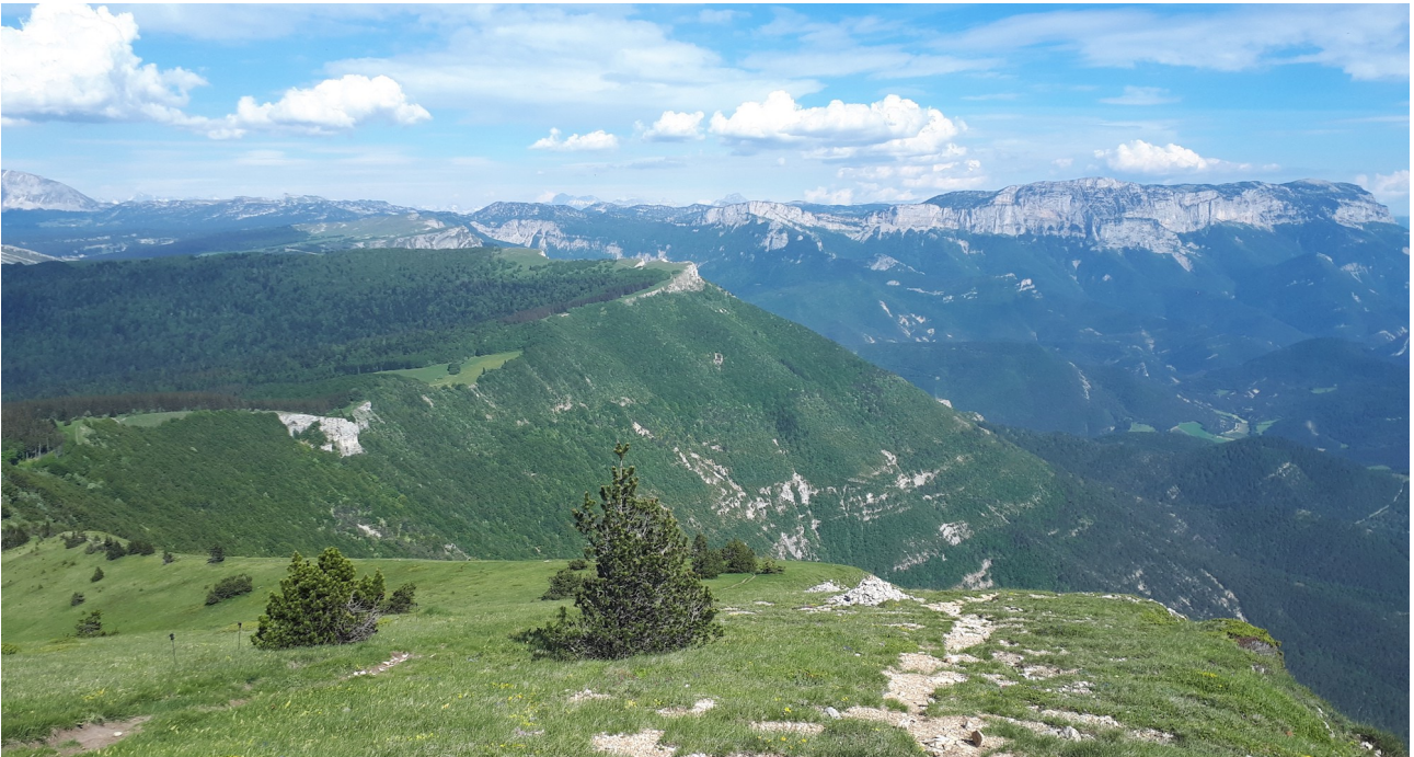
Vue panoramique du Puy de la Gagère sur le But St-Genix au centre et la montagne du Glandasse à droite

Via ferrata (ou petite randonnée alternative) et visite du Musée de la Préhistoire compléteront agréablement le séjour.