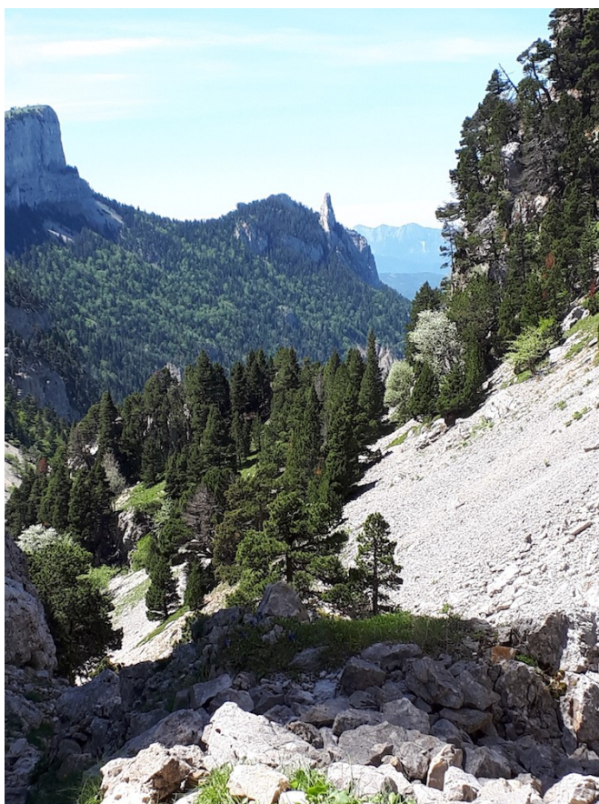
Vue sur la Dent de Die entre le pas des Econdus et le pas de Chabrinel

Paiement d'un chèque de 70 euros correspondant à la totalité de l'hébergement, à faire à l'ordre d'Amitié Nature Fontaine. En cas de désistement les arrhes ne seront rendues que si un.e remplaçant.e est trouvé.