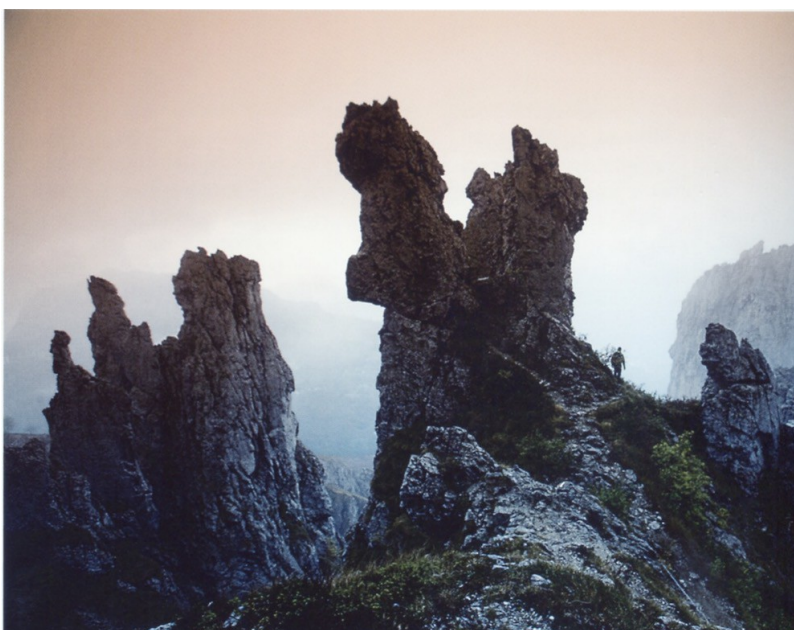
Labyrinthe rocheux dans le massif des Grignes