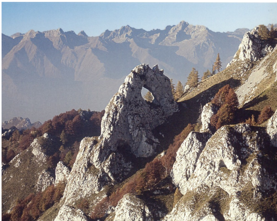
Arche naturelle dans le massif des Grignes

du 6 au 9 septembre 2018 un circuit dans le Massif des Grignes (au dessus du lac de Côme Italie)