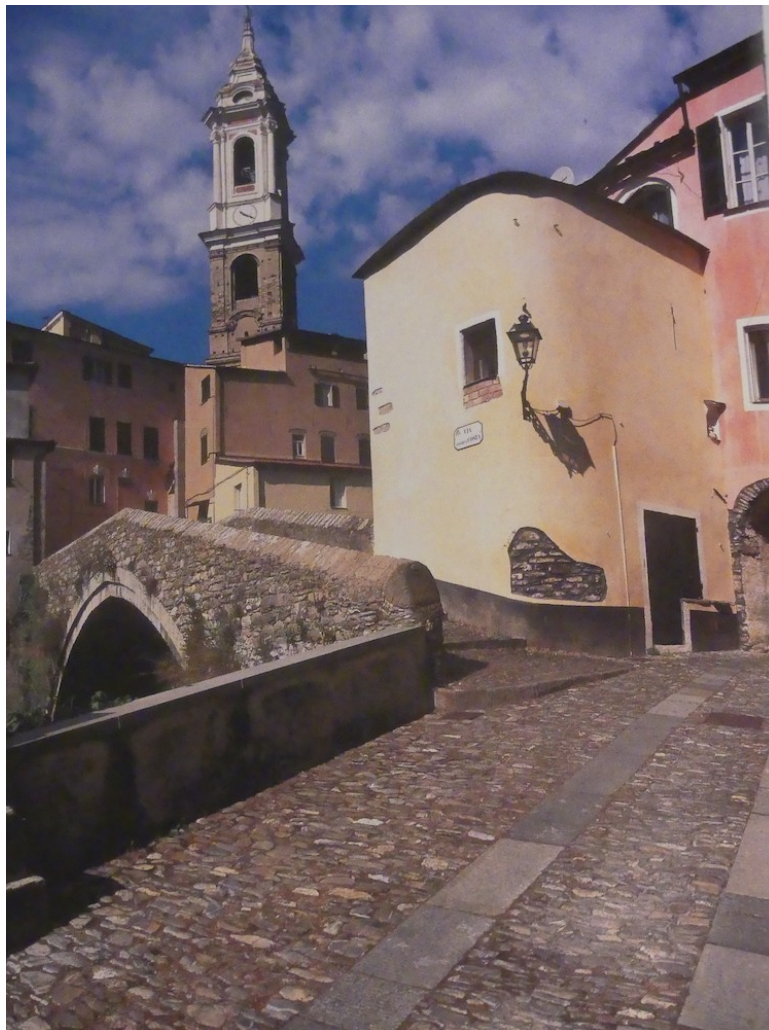
Dolcedo avec ses ruelles nommées caruggi